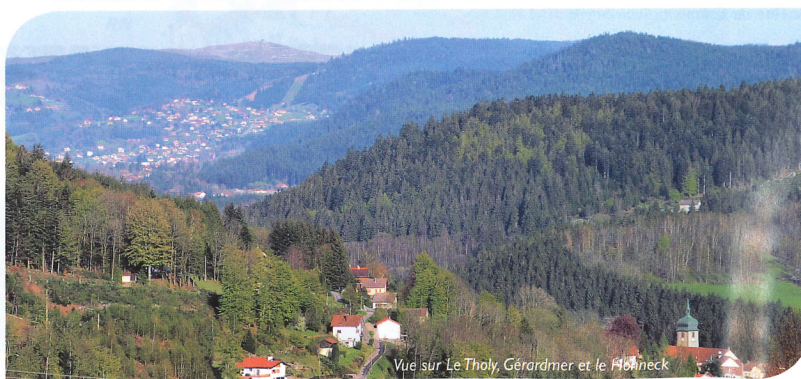
Vue sur Le Tholy, Gérardmer et le Hohneck

Extrait des fonds numériques de la carte 10925 88400 - IGN, Paris, 2017 - Actualisation IGN n° 730.170001. Reproduction interdite.